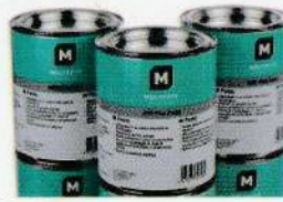
o Graisses pour engrenages

Filiale du groupe américain Dow Corning, les produits Molykote sont considérés comme les meilleurs en lubrification industrielle.