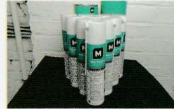
o Graisses pour roulements